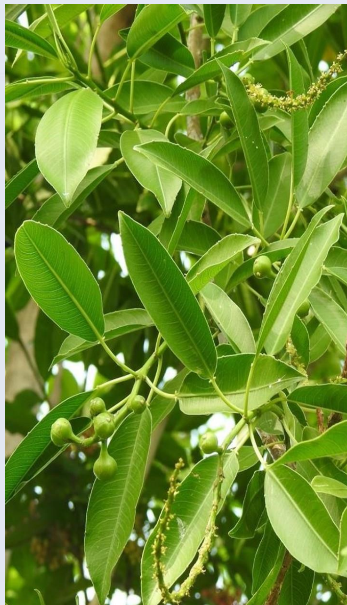
Hojas y fruto